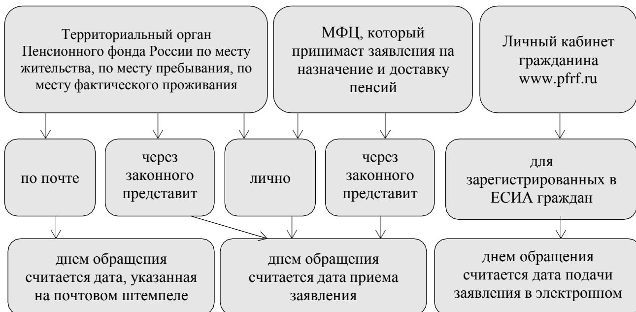
Рисунок 4 – Способы обращения за назначением пенсии

Способы обращения за назначением пенсии представлены на рисунке 4.