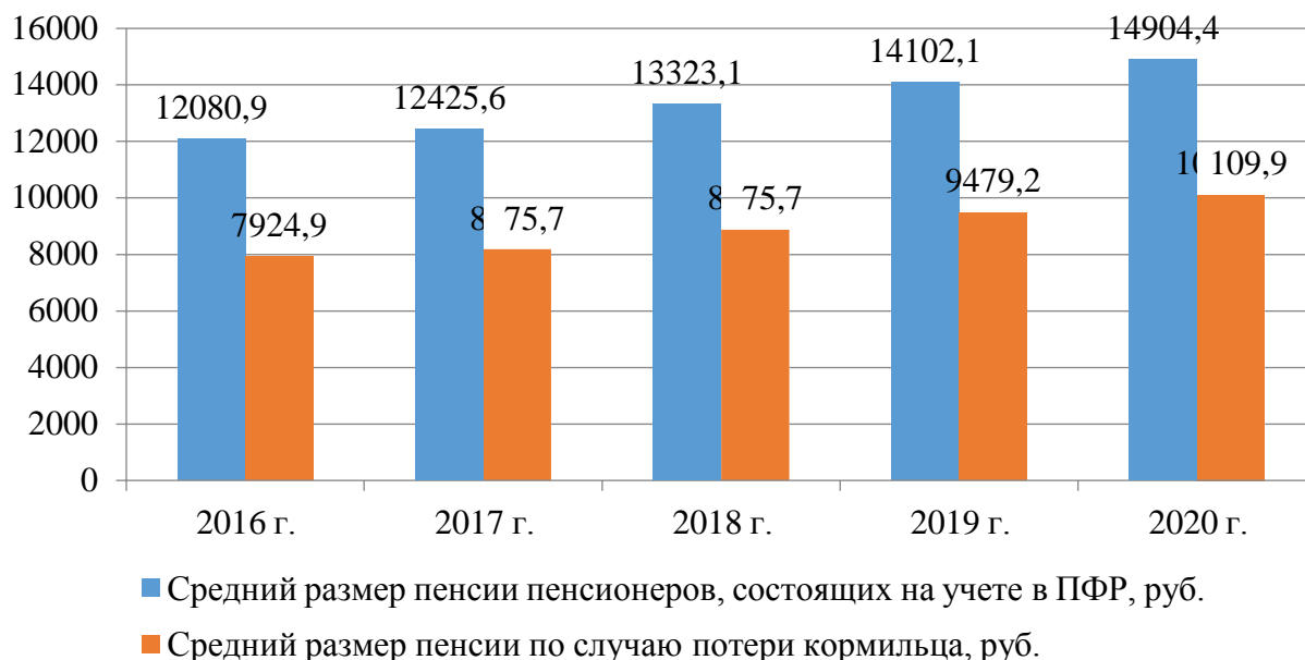
Рисунок 3 – Динамика среднего размера страховой пенсии по потере кормильца в РФ за 2016-2020 гг. (руб.)