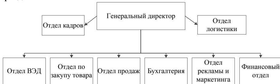
Рисунок 1.3 – Организационная структура ООО «Восток» в 2018 г.

При ссылках на иллюстрации следует писать «... в соответствии с рисунком 2» при сквозной нумерации и «... в соответствии с рисунком 1.2» при нумерации рисунка в пределах раздела.