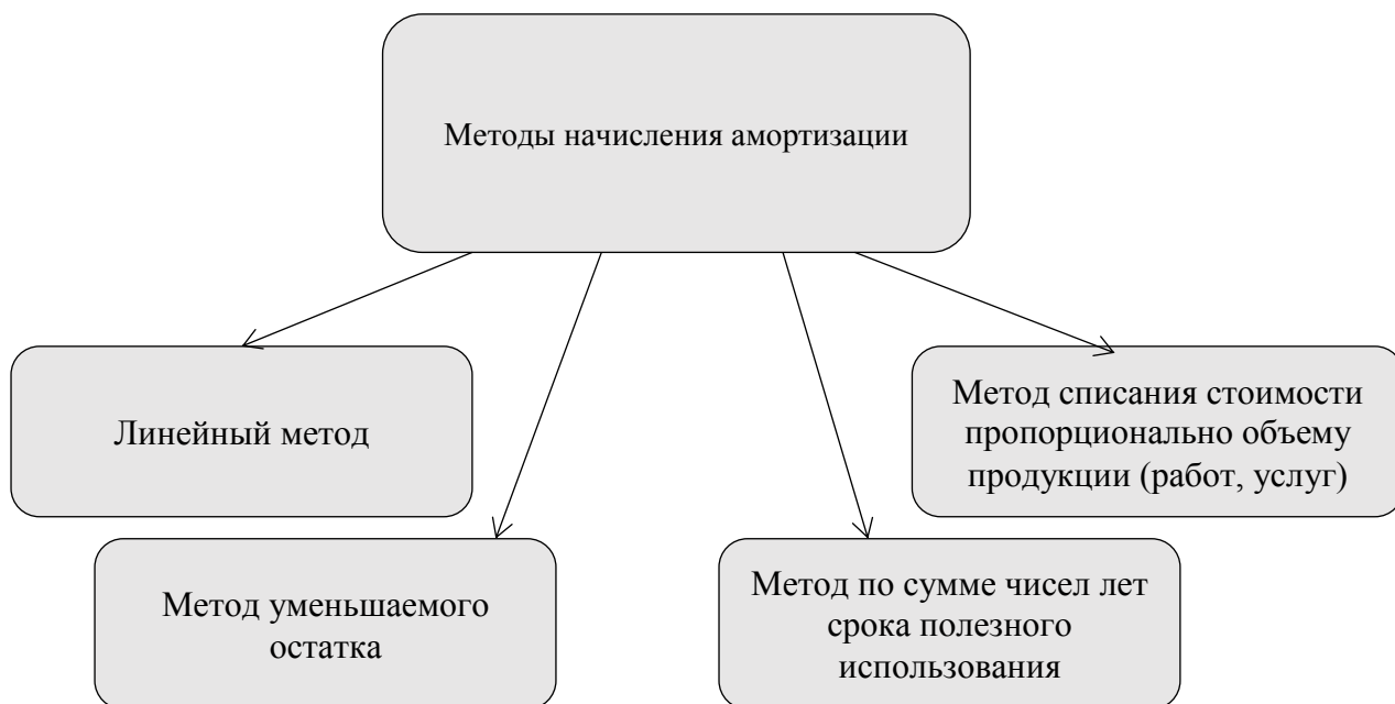
Рисунок 4 – Методы начисления амортизации

Методы начисления амортизации представлены на рисунке 4.