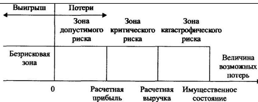
Рис. 9.1. Схема зон риска

Область, в которой потери не ожидаются, называется безрисковой зоной , ей соответствуют нулевые потери или отрицательные (превышение прибыли над потерями).