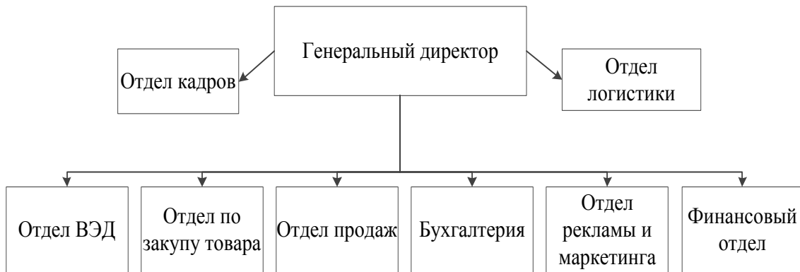
Рисунок 1.3 – Организационная структура ООО «Восток» в 2018 г.